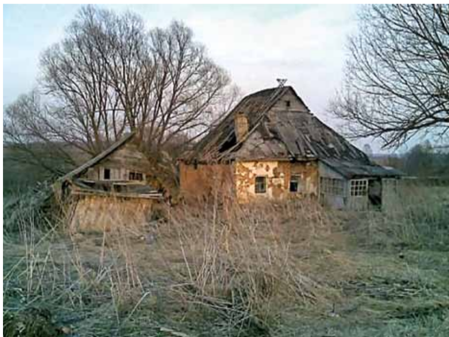
На снимке: обезлюдевшая деревня в Шахунском районе Нижегородской области.

7. Ежегодно выделять не менее 4% расходной части федерального бюджета на восстановление и строительство объектов социальной сферы на селе.