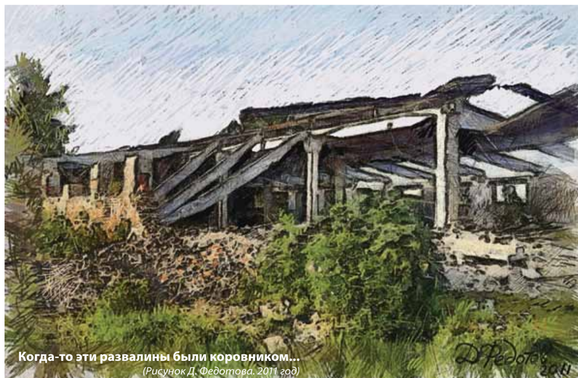
Когда-то эти развалины были коровником... (Рисунок Д. Федотова, 2011 год)

Как цены, так и качество продуктов питания государство возьмет под жесткий контроль.