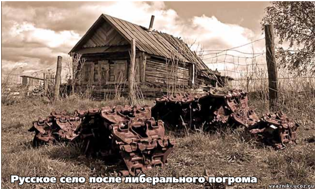
Русское село после либерального погрома

Сложившаяся ситуация требует решительных мер, а именно: разработки и реализации реальной программы развития сельского хозяйства и достойного ее финансирования в полном объеме. Промедление может стоить продовольственной безопасности, а жителей села поставить на грань выживания.