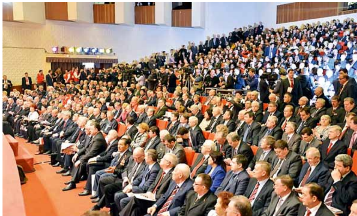
Под звуки Интернационала Съезд КПРФ завершил свою работу.

Делегаты съезда избрали Центральный комитет партии в составе 180 членов. Кандидатами в члены ЦК стали 116 коммунистов, трое из которых — нижегородцы. Центральная контрольно-ревизионная комиссия сформирована в составе 45 членов.