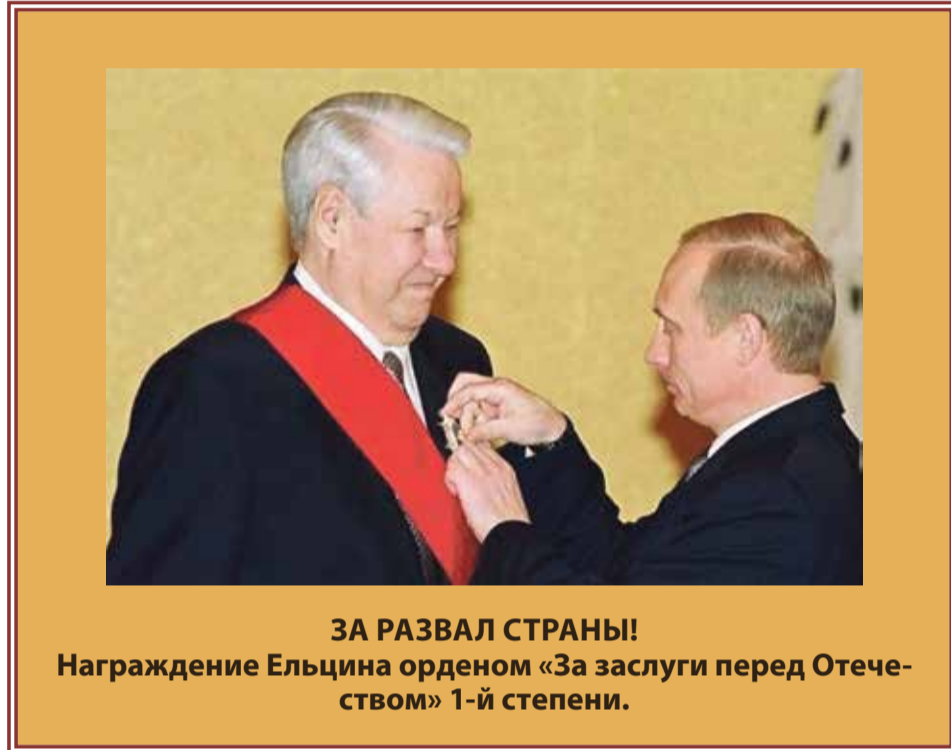
ЗА РАЗВАЛ СТРАНЫ! Награждение Ельцина орденом «За заслуги перед Отечеством» 1-й степени.

война, наша страна в самом буквальном смысле лежала в руинах. 27 миллионов погибших, многие тысячи стертых с лица земли городов и деревень в европейской части, не поддающиеся никакому учету материальные потери — вот какой ценой далась нам победа в Великой Отечественной войне, но иначе мы бы ее проиграли, и весь мир оказался бы поражен коричневой чумой нацизма.