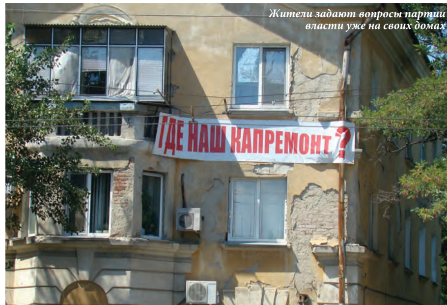
Жители задают вопросы партии власти уже на своих домах

А вот тем, у кого ремонт уже был, придется доплачивать, чтобы погасить полную стоимость выполненных работ. Ведь вы же понимаете, что новая кровля стоит намного больше, чем то, что удалось собрать жильцам? Где людям взять средства, чтобы погасить свой долг? А между тем, если они не найдут деньги, те, кто ремонта не дождался, не получают обратно свои средства. И получится, что население бу-