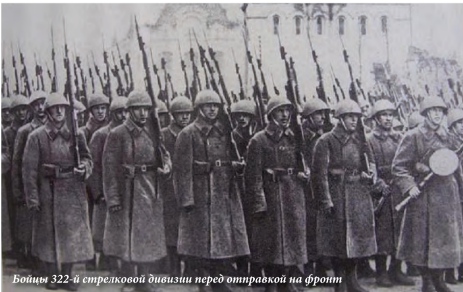
Бойцы 322-й стрелковой дивизии перед отправкой на фронт

сформировано на территории города Горького и области; — 316 нижегородцев за боевые подвиги в годы войны были удостоены высшей награды — Золотой Звезды Героя; — 171 госпиталь работал в Горьком; — 500 тысяч солдат и офицеров вернули в строй наши врачи; — 130 тонн крови сдали горьковчане для раненых; — каждая вторая армейская радиостанция была изготовлена в нашем городе; — каждая вторая подводная лодка была изготовлена в Горьком; — 596 дней и ночей город отражал воздушные атаки гитлеровцев; — 43 фашистских налета, из них 26 — ночные; — 33934 зажигательных бомб и 1631 фугасная были сброшены на Горький; — бомбардировки Горького стали самыми крупными ударами авиации Люфтваффе по тыловым районам СССР в годы войны. КПРФ обязательно добьется присвоения Нижнему Новгороду статуса Города воинской славы!