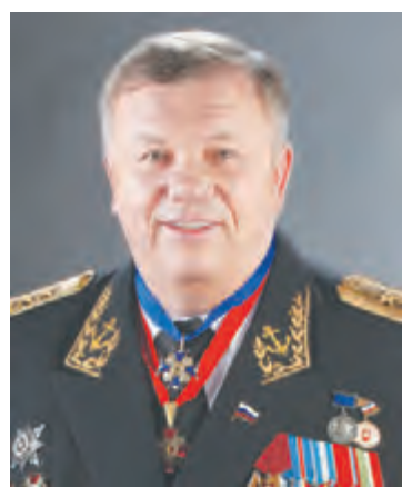
КОМОЕВ Владимир Петрович Председатель Комитета по обороне, Адмирал