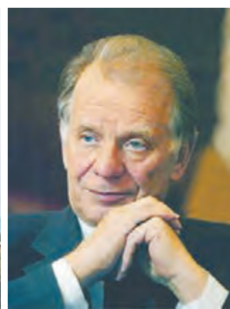
АЛФЕРОВ Жорес Иванович Депутат Государственной Думы, лауреат Нобелевской премии