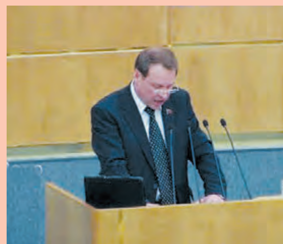
Депутат-коммунист Александр Тарнаев на трибуне Государственной Думы