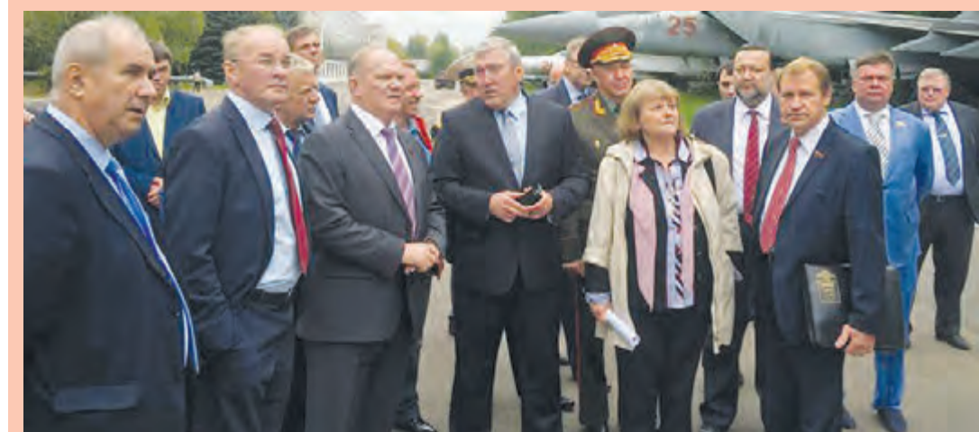
Лидер КПРФ Геннадий Зюганов и депутаты Комитета по обороне Государственной Думы Светлана Савицкая и Александр Тарнаев на нижегородском заводе «Сokol». Сентябрь 2015 г.

В 2012–2013 г.г. были разработаны и внесены в Госдуму законопроекты, предусматривающие внесение изменений в ряд законов Российской Федерации. Если отойти от юридических формулировок, изложенных в предлагаемых мною проектах, то их содержание сводится к весьма простой формуле: мужчина, не прошедший военную службу и не имевший предусмотренных законодательством оснований для освобождения от исполнения воинской обязанности, не может быть президентом, премьером, министром, депутатом Госдумы и других законодательных органов, членом Совета Федерации, сотрудником ФСБ и МВД, состоять на иной государственной и муниципальной службе.