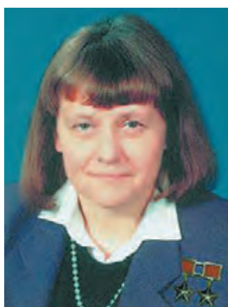
САВИЦКАЯ Светлана Евгеньевна ЗамПредседателя Комитета по обороне, Дважды Герой СССР, Лётчик-космонавт