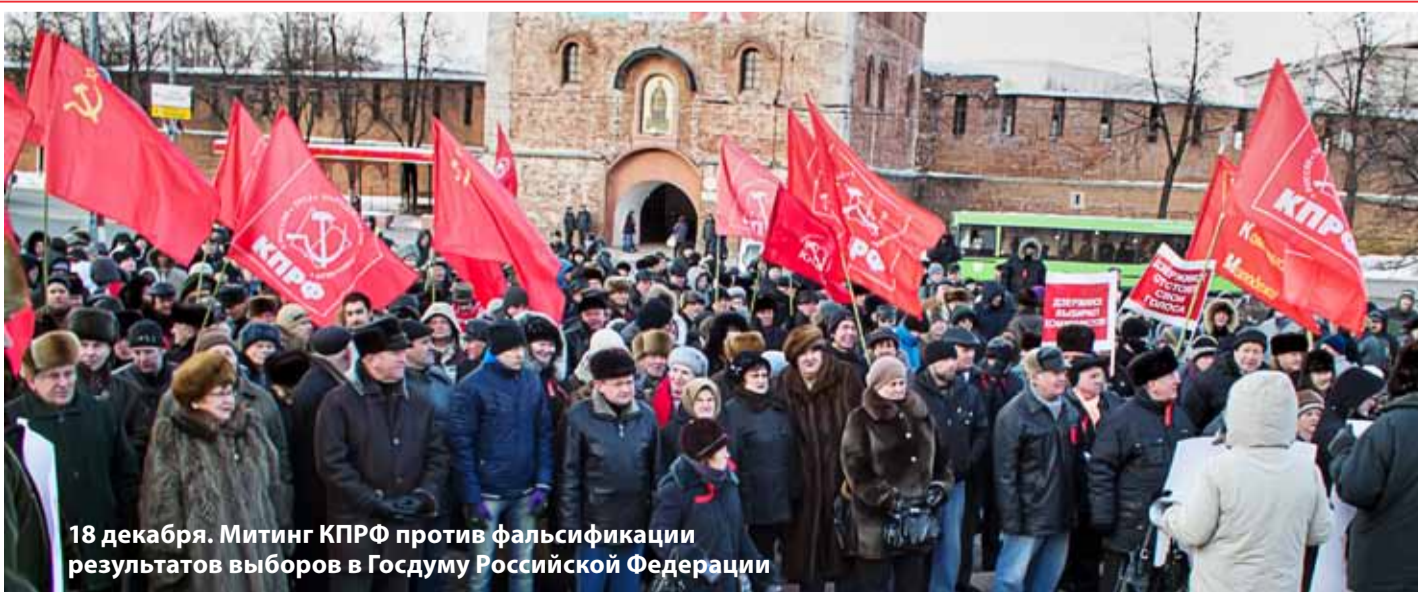
18 декабря. Митинг КПРФ против фальсификации результатов выборов в Госдуму Российской Федерации